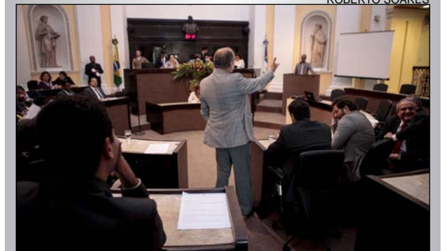
TRÂMITE - O texto será enviado ao Executivo para sanção