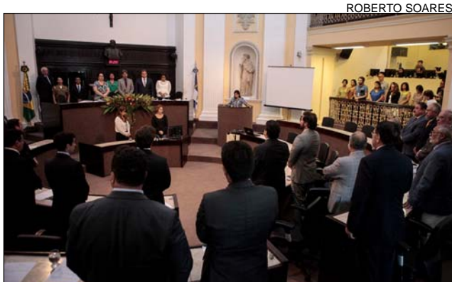
CONVÊNIO - Parceria entre União e Estado encerrou no domingo

“Nós apostamos que será divulgada em breve a prorrogação do convênio. Mas precisamos de um pronunciamento oficial do Governo Estadual sobre o tema. Não podemos colocar