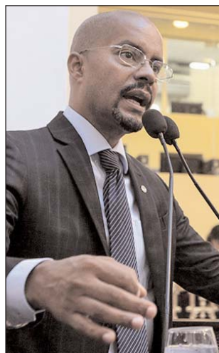
EDILSON - Estatísticas