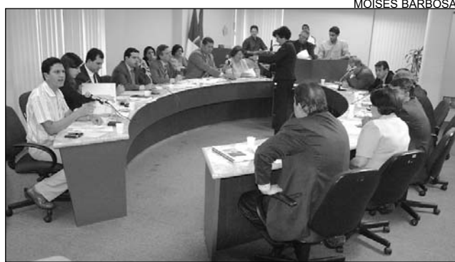
PAUTA - Aprovados três projetos que tramitavam na Casa