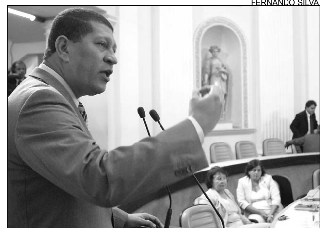
REDS - Para petista, medida do Executivo é discriminatória