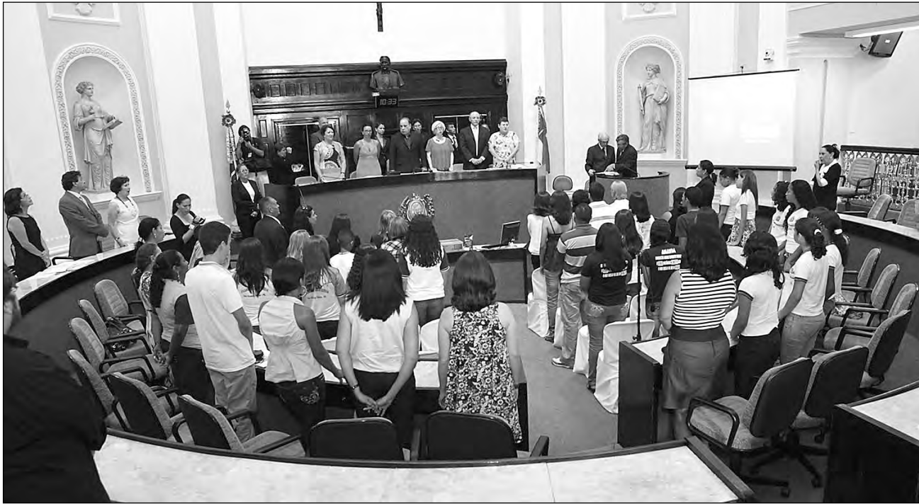
ENCONTRO - Dirigentes de escolas, alunos e familiares participaram da solenidade de premiação, no Plenário da Alepe