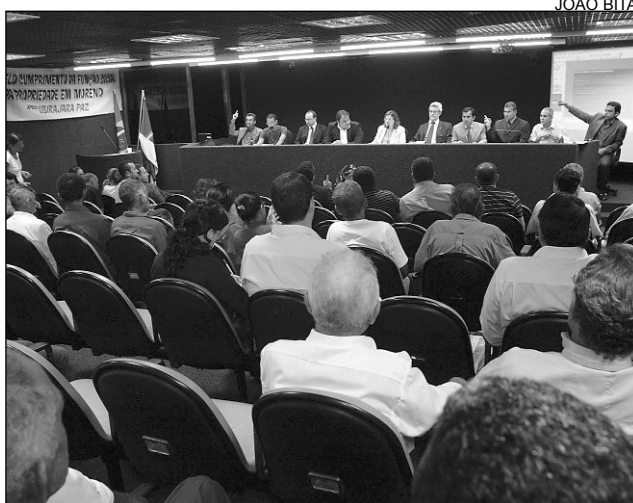
AUDIÊNCIA - Negócios Municipais ouviu população