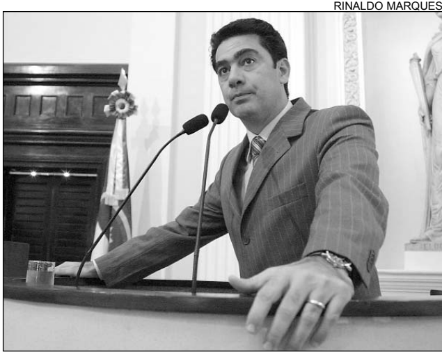
CRISE - Cidade estava com apenas um magistrado