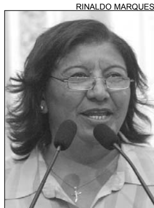
ISABEL - Potencial

Isabel lembrou que o município se destaca no cenário mundial com a exportação de