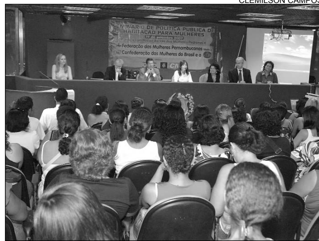
AUDITÓRIO - Evento reuniu poder público, Caixa e ONG

social, porque representam melhorias para a população. Como presidente de um colegiado voltado para a clas-