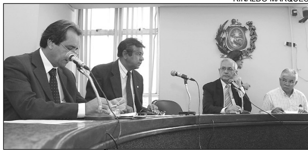
ADMINISTRAÇÃO - Parlamentares apoiaram medida

De acordo com justificativa do texto, "o assunto é de extrema relevância e envolve uma série de problemas sociais. A proposta visa prevenir as agressões, buscando caminhos mais eficazes através de