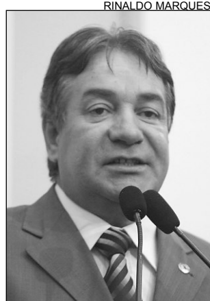
PETEBISTA - Investimentos

"É um orgulho para Garanhuns ter um empreendimento desse porte em nossa região. Serão mais de R$ 40