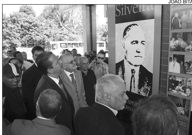
PELÓPIDAS - Uchoa e Leite acompanharam governador

Para ele, além de uma reverência justa a Pelópidas Silveira - político que investiu no desenvolvimento urbano do Recife -, "a conclusão do terminal é o exemplo con-