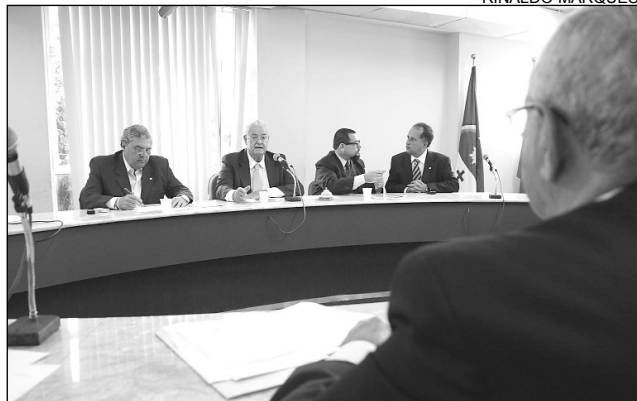
COLEGIADO - Finanças deu parecer favorável à matéria