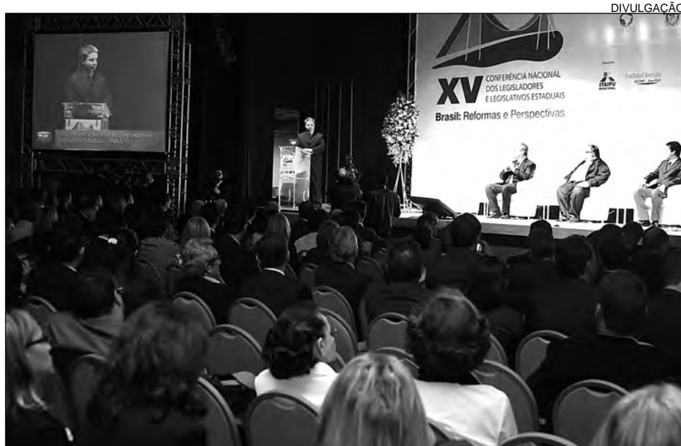
ABERTURA - Solenidade reuniu parlamentares de 26 Estados, Distrito Federal e nove países

A palestra de Luís Nassif focou o panorama econômico e político do Brasil. Pioneiro em jornalismo online no País, Nassif analisou que o desenvolvimento passa pela regionalização da economia. No campo político, o palestrante destacou que os parlamentares devem aprimorar a função de representar os eleitores. “Isso depende, sobretudo, da transparência. TVs, rádios e agências de notícias legislativas são fantásticas como meios para fortalecer