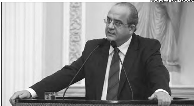
CARNAVAL - Lessa ressaltou sucesso dos Papangus