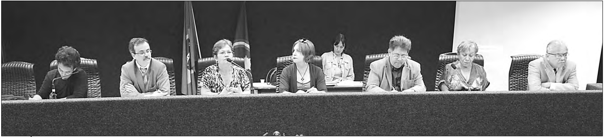
AUDITÓRIO DA ALEPE - Representantes de diversas entidades cobraram providências ao Governo Estadual. Mulheres contaram problemas enfrentados pelos maridos detidos