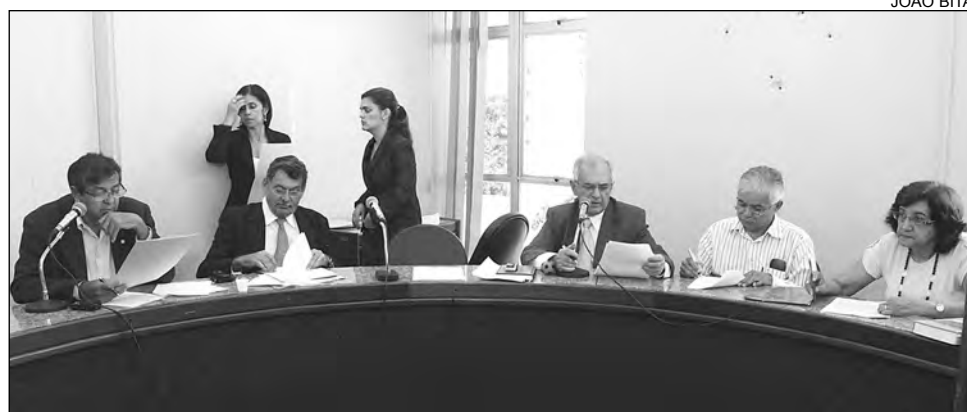
DIVERSIFICAR - Montante deliberado pelo Executivo beneficiará Fundarpe, Fehidro e Pasep

De acordo com a gestão estadual, a Fundarpe receberá R$ 3,6 milhões para custear ações de fomento, preservação, formação e