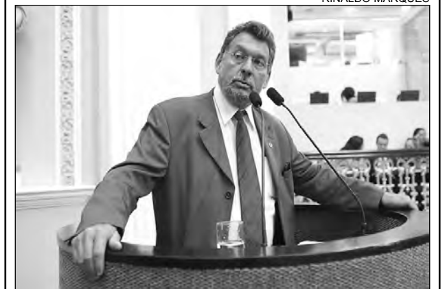
PEREIRA - Atenção ao trabalho dos conselheiros