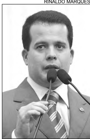
VIEIRA - Providências

As caravanas promovidas pelo Conselho Regional de Medicina de Pernambuco (Cremepe) e pelo Sindicato dos Médicos de Pernambuco (Simepe), este ano, constataram a cobrança de taxas para a realização de exames nas unidades públicas de saúde dessas cidades. “A situação é abusiva, pois a população carente precisa do serviço, que deve ser gratuito. As autoridades