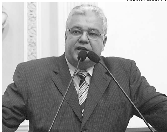
HISTÓRIA - Moraes citou potencial da Terra dos Maracatus

Conhecida como a Terra dos Maracatus, é uma das cidades do Interior que mais congregam manifestações culturais. São cerca de 11 grupos de maracatus, além dos que se dedicam a enaltecer o cavalo-marinho, coco, forró, entre outros ritmos. No período carna-