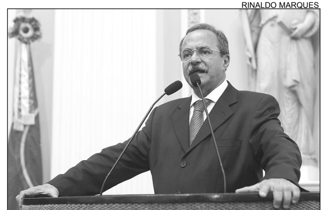
ENCOMENDA - Eurico disse que ação é feita por especialista

O furto, na Sexta-Feira Santa, foi denunciado pelo deputado Pedro Eurico (PS-DB). A imagem de Nossa Senhora do Carmo, padroeira da cidade, era a mais importante da igreja e ocupava lugar de destaque no templo. “A Polícia Federal e o Instituto do Patrimônio Histórico e Artístico Nacional (Iphan) devem buscar providências. Esse tipo de crime é cometido por especialistas e feito sob encomenda, por causa do alto valor das peças. As imagens