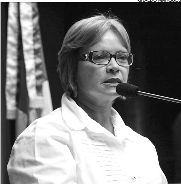
HOMENAGEM - Nadegi ressaltou importância da entidade