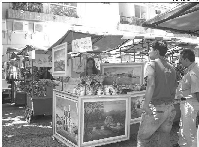
ARTESANATO - Atividade movimenta cerca de R$ 28 bi/ano