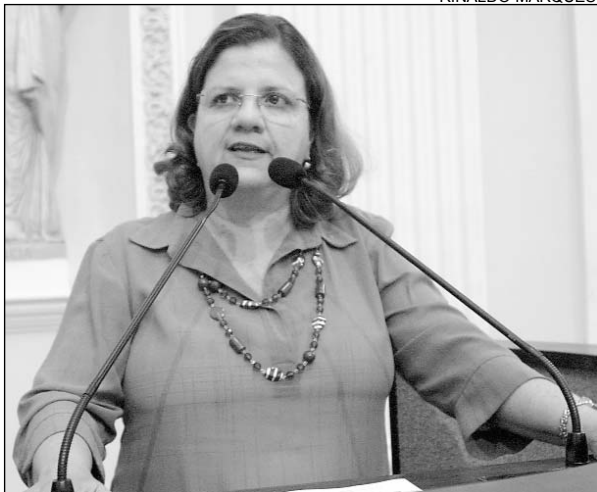
TERESA - Congresso apreciará matéria sobre o assunto