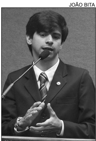
AIRINHO - Encontro

A viabilização de um estudo para reativar a antiga usina de algodão, localizada no município de Mirandiba, Sertão Central, foi solicitada pelo deputado Airinho (PSB), ontem, no Plenário. Na ocasião, o parlamentar fez um apelo ao governador do Estado, Eduardo Campos (PSB), e ao secretário estadual de Ciência, Tecnologia e Meio Ambiente, Aristides Monteiro, para implantar a proposta.