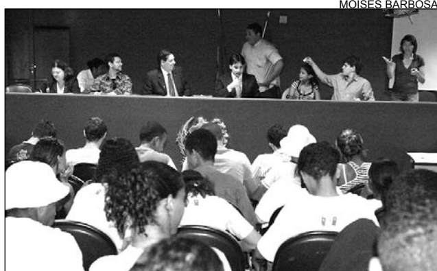
PRAZO - Relatório deve ser apresentado até dezembro

Para o juiz, a solução "passa pela construção de uma sociedade comprometida