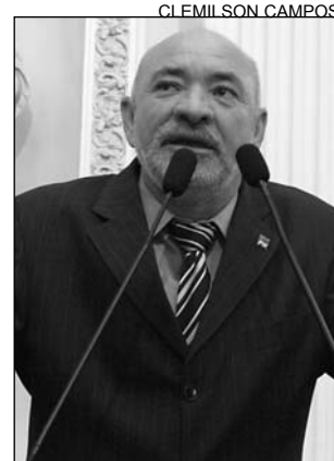
SANTOS - Providências

"Vou solicitar à Superintendência da Polícia Rodoviária Federal a instalação de lombadas eletrônicas em São Caetano. Os radares para medir velocidade intimidam os motoristas e diminuirão os acidentes, pois quem ultrapassa a velocidade permitida recebe multa e pontos na carteira de habilitação", salientou o republicano, acrescentando que a construção de passarelas no trecho da BR não é