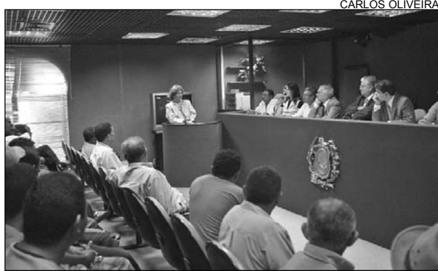
REUNIÃO - Desenvolvimento Econômico abordou o tema

"A obra foi realizada para perenizar o Rio Sirigi e contribuir para a irrigação da agricultura", destacou, acrescentando que a criação de tilápias pode diversificar a economia da Mata Norte, que, atualmente, depende exclusivamente da plantação de cana-de-açúcar. O projeto de instalar tanques-redes de tilápias pode beneficiar mais de 40 famílias que vivem às