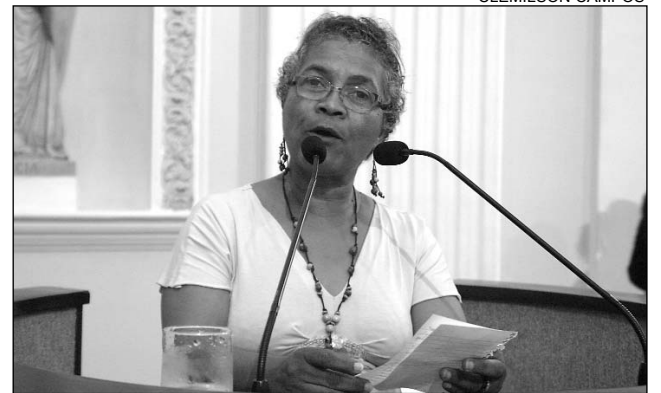
CEÇA - Cidade do Paulista receberá R$ 12 milhões