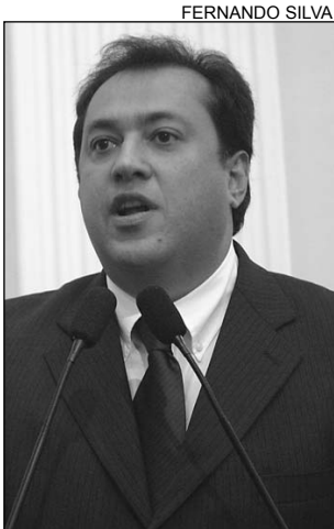
GOVERNO - Indagações

O deputado Sebastião Oliveira Júnior (PL) reafirmou, ontem, as críticas feitas por ele, na Folha de Pernambuco , na última terça-feira, contra o presidente estadual do PFL e deputado federal, André de Paula. Oliveira Júnior rebateu as declarações do presidente do PFL, que reforçavam a acusação do governador Mendonça Filho (PFL) de que o deputado federal Inocêncio Oliveira (PL) teria, supostamente, negociado Secretarias Estaduais em troca de apoio político. "André de Paula precisa ter respeito à