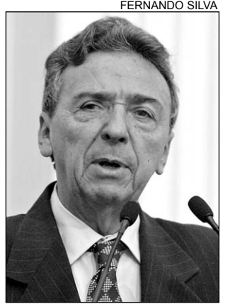
QUEIROZ - Urgência

O opositor lembrou que a Casa aprovou, há cerca de dois meses, o Projeto de Lei nº 1333, do Poder Executivo, que altera a destinação dos recursos do Fundo Rodoviário de Pernambuco (Fur-