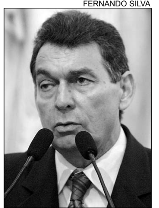
ELEIÇÃO - Agradecimento

Para o comunista, as elites brasileiras discriminam os ativistas dos movimentos sociais, procurando sempre colocá-los à margem da sociedade. O deputado ainda