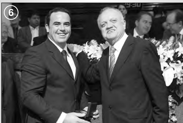
TRABALHO - 1º secretário e presidente da Alepe