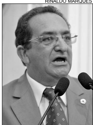
BRINGEL - Empresariado

“Isso será ótimo para o desenvolvimento da região e, como representante da área, quero registrar meus agradecimentos”, destacou. De acordo com o texto, o crédito estará restrito ao transporte rodoviário interestadual de cargas. Somente o imposto que incide sobre esse serviço será praticado nesse formato. A proposição foi aprovada, por unanimidade, em primeira discussão e retornará ao Plenário para ser apreciada em segunda discussão e redação final, antes de seguir para a sanção do governador.