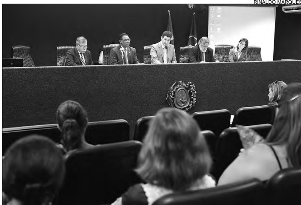
AUDITÓRIO - Presidente do grupo (C) disse que colegiado acompanhará negociações

O Rio Grande do Sul paga a um defensor público R$ 24 mil. Ceará e Bahia, R$ 15 mil; e Alagoas, R$ 18 mil. Atualmente, 278 defen-