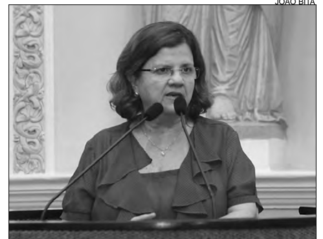
SOLIDARIEDADE - Teresa Leitão propôs negociar

Documento com as propostas das categorias foram enviadas ao Palácio do Campo das Princesas e ao presidente da Alepe, deputado Guilherme Uchoa (PDT).