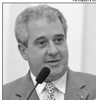
COUTINHO - Clareza

tratando sobre a inclusão do nome do parlamentar nas proposições. "O objetivo é proporcionar mais transparência, facilitando o compartilhamento de informações entre a sociedade e o autor dos projetos", destacou, na justificativa da matéria.