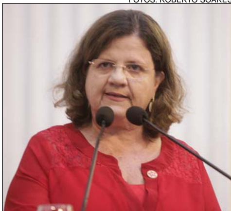
TERESA - “Inauguração de instituto”

A trajetória política de Manoel Santos sempre esteve ligada ao campo. Filho de integrantes do Movimento Sem-Terra, começou a trabalhar como agricultor aos seis anos de idade. Na década de 1970, ingressou no Sindicato dos Trabalhadores Rurais de Serra Talhada, exercendo a função de tesoureiro e, em seguida, assumindo a presidência do grupo, em 1981.