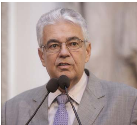
MORAES - “Convivência de muito respeito”