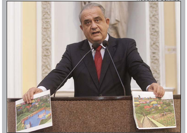
AÇÃO - Iniciativa é da Prefeitura do Recife