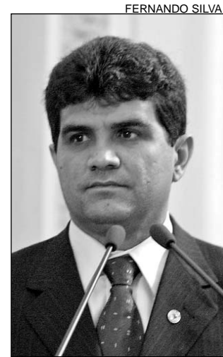
CLAUDIANO - Elogios

De acordo com o deputado, o fato é de grande relevância. Segundo o site da Associação Municipalista de Pernambuco (Amupe), há 13.148 habitantes em Jatobá (Censo do IBGE/2000) e o Índice de Desenvolvimento Humano é 0,69 (Atlas de