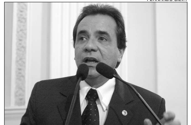
QUALIFICAÇÃO - Preparar mão-de-obra para Suape