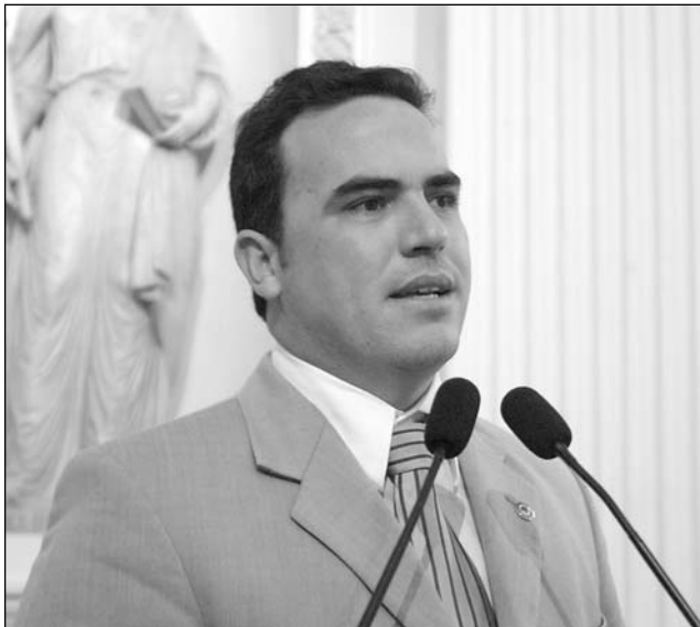
HERANÇA - Socialista diz que região foi esquecida