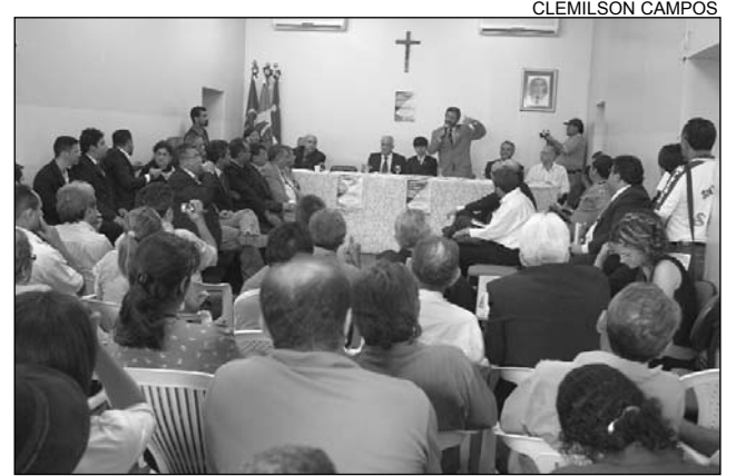
SALGUEIRO - Medida limita corte de energia na zona rural

Instalada há 90 dias, a CPI da Celpe realizou outras três audiências no Interior. A primeira ocorreu no mês de julho, quando os deputados visitaram Araripina. As duas seguintes aconteceram em agosto, nas cidades de Caruaru e Garanhuns.