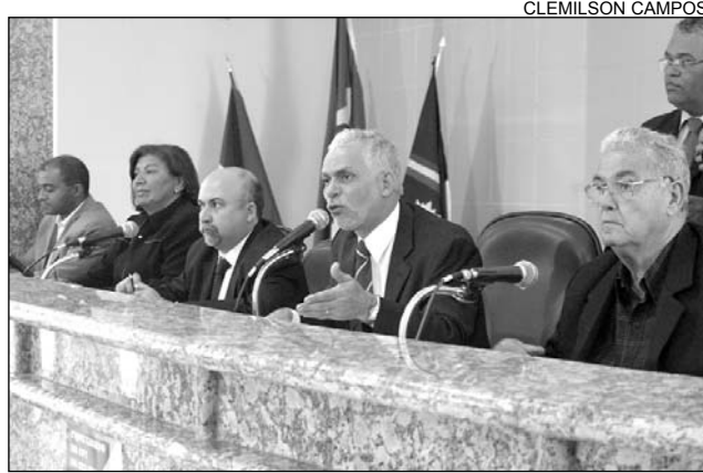
PETROLINA - População reclamou de muitas elevadas

SALGUEIRO - Na Câmara Municipal de Salgueiro, a audiência seguiu o mesmo formato. Insatisfeitos com o trabalho da Celpe, vereadores, comerciantes e consumidores residenciais relataram uma série de problemas. O presidente da Câmara, Alvinho Patriota (PSB), destacou que a Casa promoveu, no último mês de maio, audiência pública para discutir as denúncias contra a Celpe. "No encontro, debatemos alternativas para defender os consumidores que se sentem