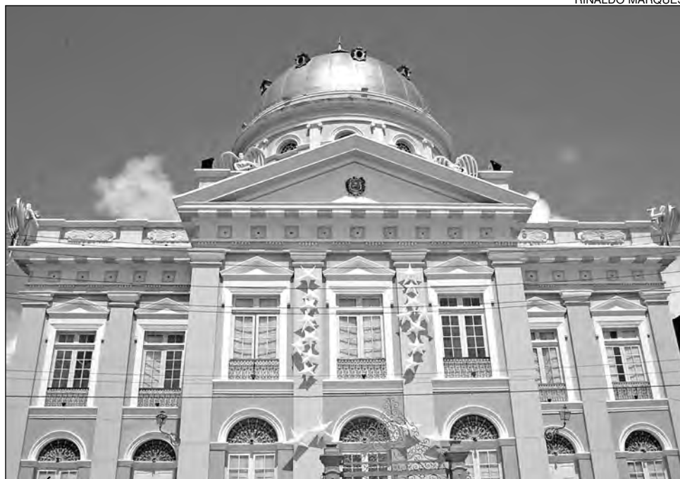
PALÁCIO - Sede do Poder Legislativo de Pernambuco é palco do evento na noite de hoje

A Medalha Joaquim Nabuco - Classe Ouro - é concedida anualmente a pessoas físicas ou jurídicas imbuídas de elevado espírito público e com relevantes serviços prestados a Pernambuco ou à pátria. A Fundação Joaquim Nabuco receberá a comenda por sugestão do presidente da Alepe, deputado Guilherme Uchoa (PDT). A entidade, fundada em 1949, teve sua criação inspirada no discurso do sociólogo Gilberto Freyre, na Câmara dos Deputa-