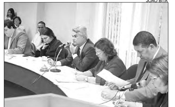
ENCONTRO - Detalhes do trajeto foram apresentados