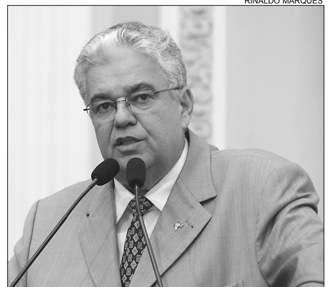
PROVIDÊNCIA - Moraes falou com chefe da Polícia Civil

Em aparte, a presidente da Comissão de Cidadania e Direitos Humanos da Alepe,