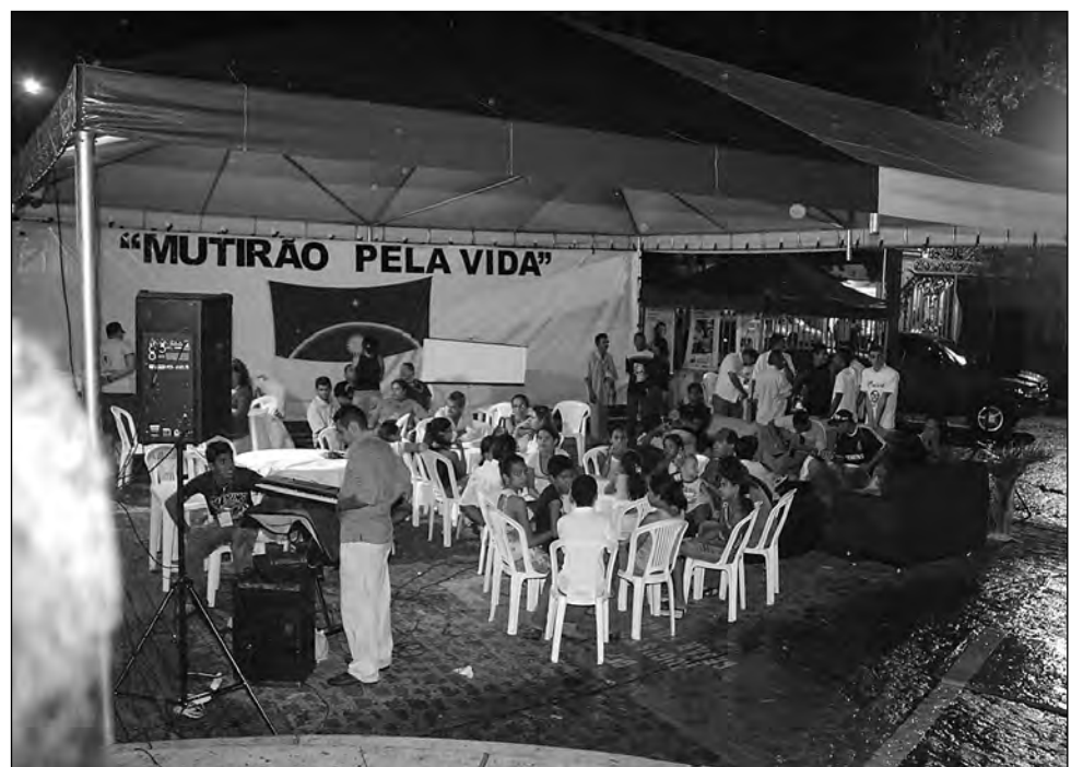
SARAVIDA - ONG conversou com familiares e dependentes químicos que desejam mudar