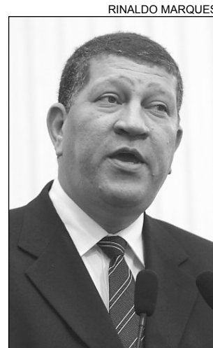
VÍTIMAS - Nascimento

“Esse é um tema que preocupa, principalmente, os profissionais de saúde. As emergências estão lotadas”, observou Pimentel. “É preciso conscientizar a população”, comentou Moisés. “Mais um feriado se aproxima (São João) e é necessário prudência. Muitas vidas se perdem em acidentes todos os anos”, completou Feitosa.