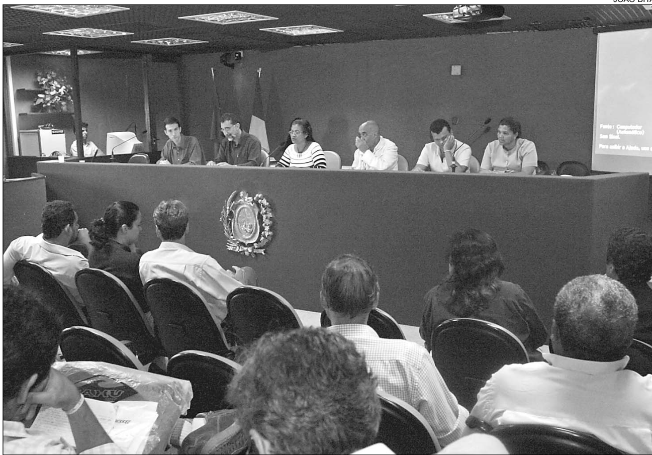
MINISTÉRIO PÚBLICO - Comissão de Meio Ambiente da Alepe solicitará estudo sobre viabilidade ambiental

Representantes da Prefeitura de Jaboatão dos Guararapes, da Agência Estadual de Meio Ambiente e Recursos Hídricos (CPRH), do Instituto Agrônomo de Pernambuco (IPA), entre outras instituições, também participaram da audiência.