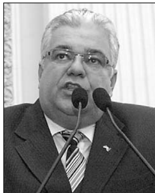
MORAES E NEGROMONTE - Exaltação à conduta ética