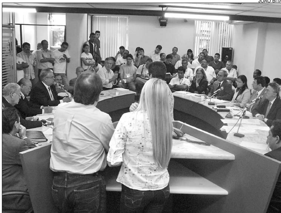
ANÁLISE - Diversas entidades receberam proposta de Antônio Moraes para avaliar

Conforme argumento da companhia, a criação de peixes nas represas impulsionaria a proliferação de algas – algumas