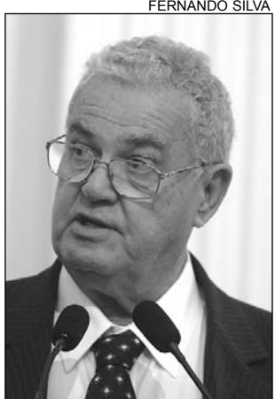
COELHO - Elogios

O pefelista, que participou do evento, registrou o