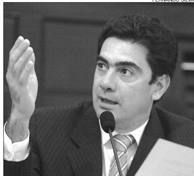
PIMENTEL - Reivindicação depende do Governo Federal

De acordo com o segundo vice-presidente, a Assembleia não pode intervir no anteprojeto de lei que está sendo avaliado pelo Governo Federal e