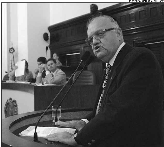
TURISMO - Litoral Norte precisa de investimentos

De acordo com o parlamentar, só com a saída do complexo prisional será possível o desenvolvimento da Área Metropolitana Norte. "Em 2005, quando o então secretário estadual de Defesa Social, João Braga, anunciou que o Estado tinha um projeto para a retirada dos presídios, incluindo a venda dos terrenos para empresas de turismo, foi um alívio", disse, acrescentando que, com o passar do tempo, a alegria se transformou em frustração para os moradores. No último dia 13, populares