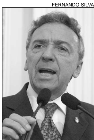
PEDETISTA - Solicitação

"No fim de semana passado, visitei duas localidades rurais e me deparei com uma cena que me despertara outras vezes. Uma senhora com uma lata na cabeça foi a um pequeno barreiro e recolheu água para a família consumir e lavar louça", lamentou. O pedetista afirmou que na maioria das comunidades rurais de Pernambuco o episódio se repete. A água contaminada