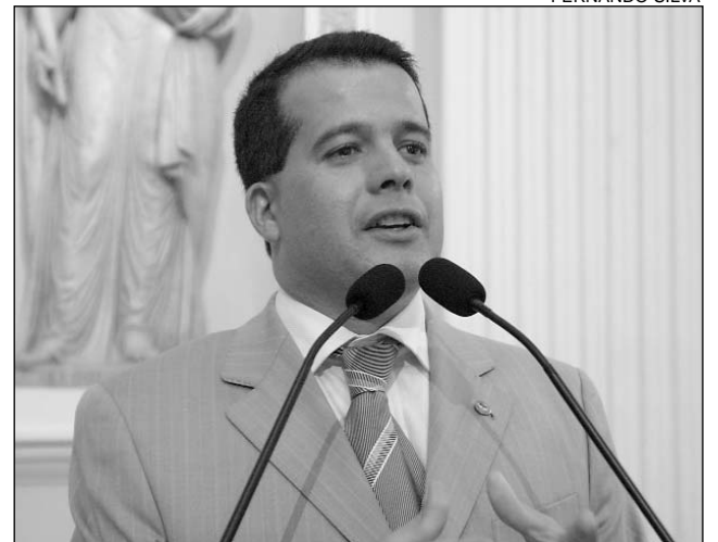
DÉFICIT - Pernambuco precisa de 380 mil novas moradias