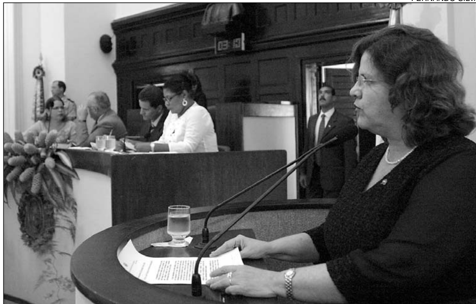
CONQUISTA - Para Teresa, resultado confirma que o Governo Lula está no rumo certo

"A conclusão é de que o programa, criado em 2004 pelo Governo Lula, promove efetivamente a democratização do acesso à educação. Não é apenas uma iniciativa paliativa", ressaltou. A petista também frisou que, do ponto de vista didático, o ensino está ao al-