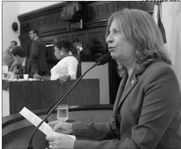
DEPUTADA - Emenda garante direito às mulheres

A parlamentar alegou que o Estatuto dos Policiais Militares do Estado ignora a determinação ao estabelecer que os militares se aposentem aos 30 anos de serviço, independentemente de ser homem ou mulher. "A explicação é que o estatuto foi aprovado por meio da Lei nº 6.783, de 1974, anterior à emenda constitucional. Porém, não é aceitável a continuidade do fato, uma vez que as