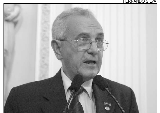
DEMOCRATA - Cobrança de implantação ao presidente Lula

Os deputados federais precisam cobrar ao presidente da República, Luiz Inácio Lula da Silva, a implantação da Agência de Desenvolvimento do Nordeste (Adene). A avaliação é do deputado Mavíael Cavalcanti (DEM), que solicitou apoio aos parlamentares que integram à Casa de Joaquim Nabuco. Segundo o democrata, a recriação do órgão foi aprovada no Congresso Nacional, no fim do ano passado. "O tema é antigo, desgastado para muitos, no entanto continuo acreditando que é relevante para Pernambuco e os demais Estados nordestinos. Os problemas que afetam a região continuam desafiando o Governo Federal que assiste ao quadro de forma passiva", lamentou.