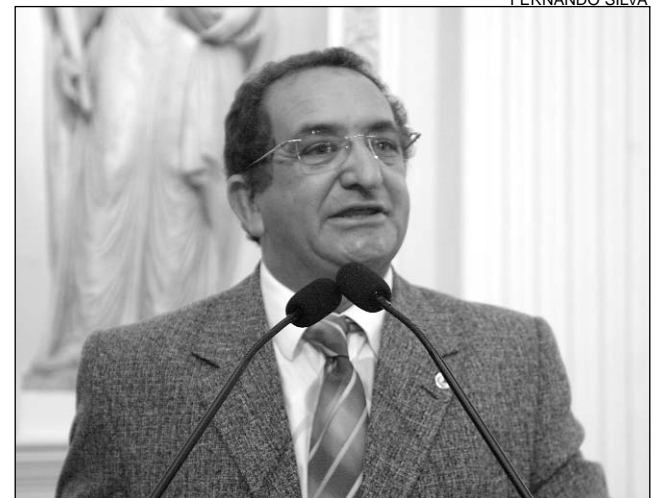
CAMINHÕES-PIPA - Tucano fez apelo ao governador