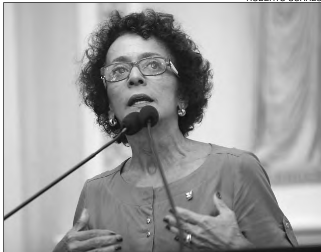
LAURA - Iniciativa trará inúmeros benefícios para região

A socialista ainda agradeceu ao deputado e ex-se-