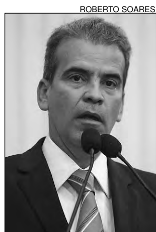
CONCURSO - Feitosa