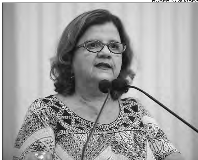
TERESA - Mobilização envolve interesses da sociedade

A CNTE, de acordo com a petista, não concor-