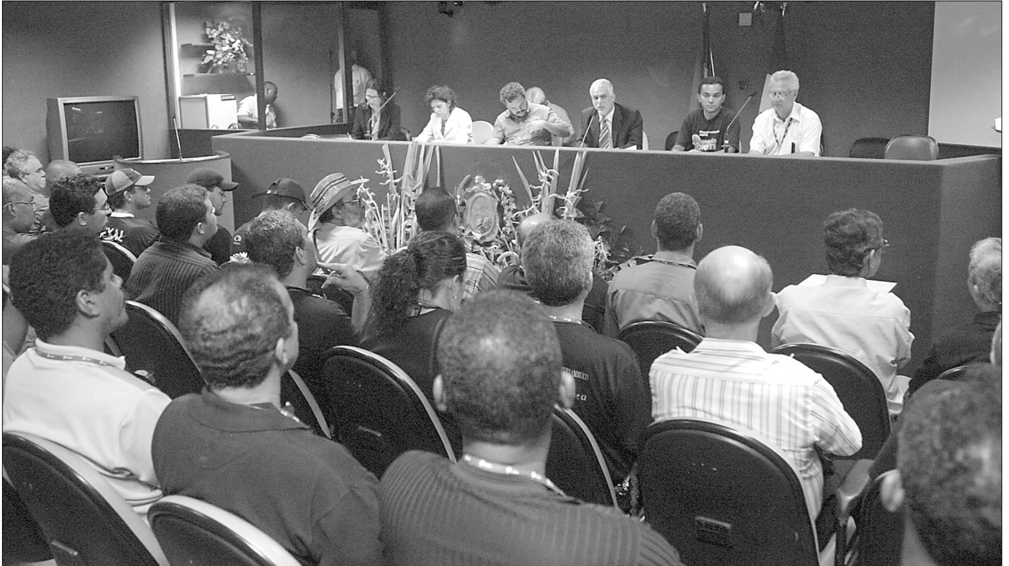
REUNIÃO - Representantes do Sindicato dos Urbanitários de Pernambuco e da Superintendência Regional do Trabalho e Emprego, antiga DRT, lotaram o auditório