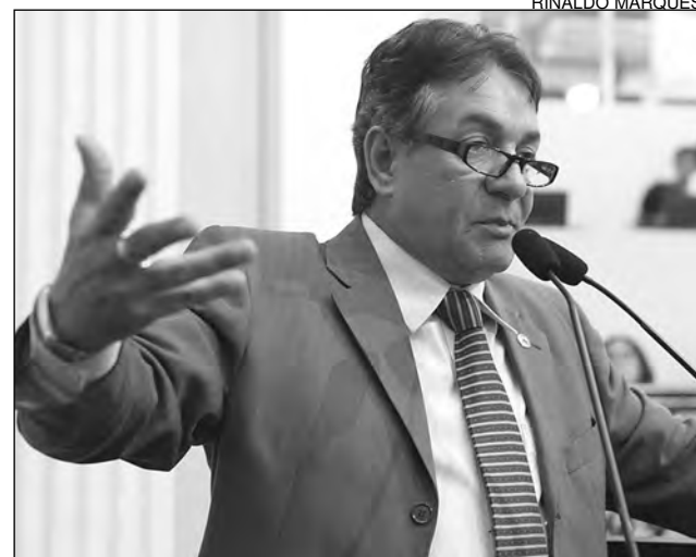
IMPrensa - Petebista rebateu nota publicada em jornal

O que está em questão no TRF, de acordo com o parlamentar, é uma radiocomunidade, enquanto a nossa solicitação era de uma radioescola”, esclareceu, alegando que a emissora teria o objetivo de formar locutores e técnicos, a exemplo do que acontece em São Paulo.