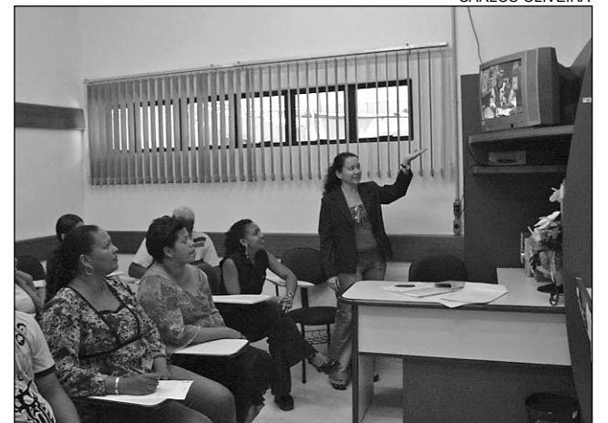
SUPLETIVO - Proposta é investir na formação contínua