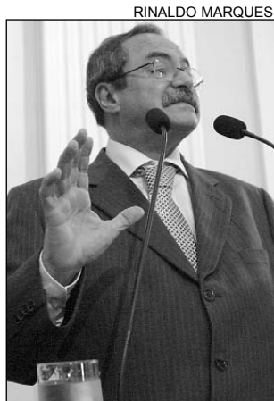
EURICO - Questionamentos

De acordo com o tucano, com o total gasto no parque, a Prefeitura poderia beneficiar muita gen-