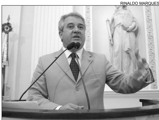
COUTINHO - Manutenção periódica das construções

De acordo com Coutinho, a idéia surgiu após debate com representantes do setor da construção civil. "Concluimos que alguns pontos precisam ser melhorados, como a periodicidade da manutenção das construções com mais de 20 anos, que, antes, deveriam ser