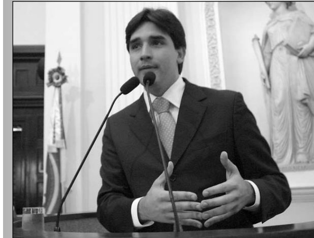
PARLAMENTAR - Setor produtivo está no rumo certo

ainda, estudo feito pela Agência Estadual de Planejamento e Pesquisas revelando que o empresariado local está positivo e espera melhorias em seus negócios até o final do ano. "Cerca de 63,3% das indústrias estão acreditando no Estado", observou.