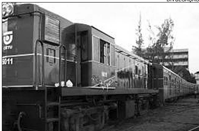
REATIVAÇÃO - Volta dos trens vai beneficiar população

Obra tem início em Quipapá, Mata Sul, e seguirá até o Recife