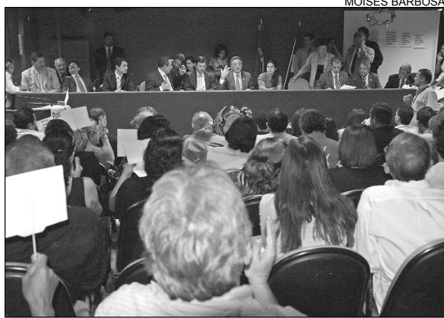
RESULTADO - Colegiado e servidores do TJ comemoraram

O petebista destacou a participação e preocupação dos parlamentares durante a negociação. "Tivemos dois pontos de grande discussão. Um deles está relacionado ao impacto financeiro, que foi detalhado. Pedimos, inclusive, ao TJPE o envio dessas informações. Em momento algum esses valores devem elevar o que está definido no Programa de Ajuste Fiscal (PAF) e fizemos questão de frisar isso em nosso parecer. Outro