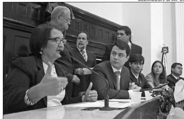
SAÚDE - Audiência pública debateu Segurança Alimentar

em Pernambuco sofrem de anemia, que é uma doença causada pela fome. Ela informou que 72% das escolas no Estado não oferecem alimentação adequada.