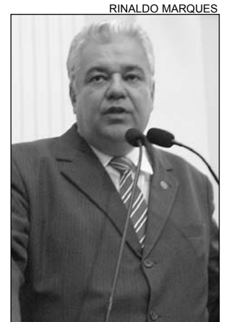
MORAES - Críticas

Segundo o parlamentar, a justificativa dos vereadores estaria relacionada aos congestionamentos regis-