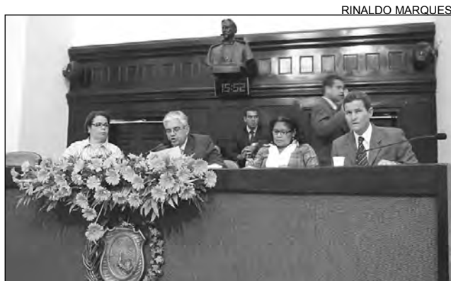
LUTO - Trajetória política foi lembrada na reunião plenária