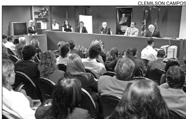
AUDITÓRIO - Público assistiu atento às explicações