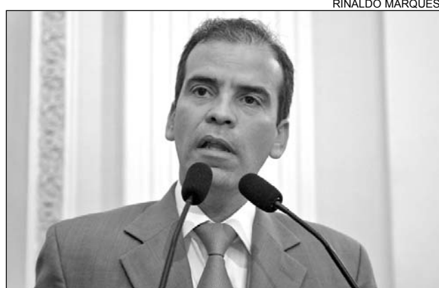
FEITOSA - Economia da região é baseada na agricultura

O parlamentar pediu que seja viabilizada a concessão de 1.500 horas de trator para a limpeza e construção de pequenos barreiros. "O abastecimento, durante o período de longa estiagem, é de grande utilidade para os agricultores do local",