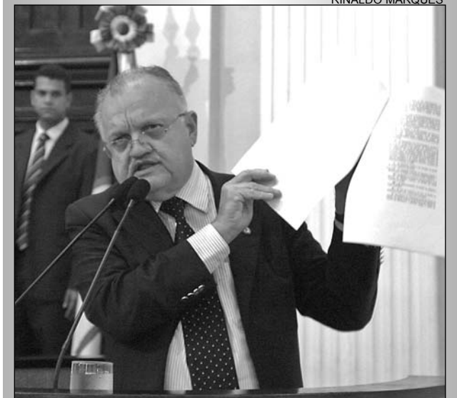
CONGRESSO - Alepe precisa aguardar decisão federal