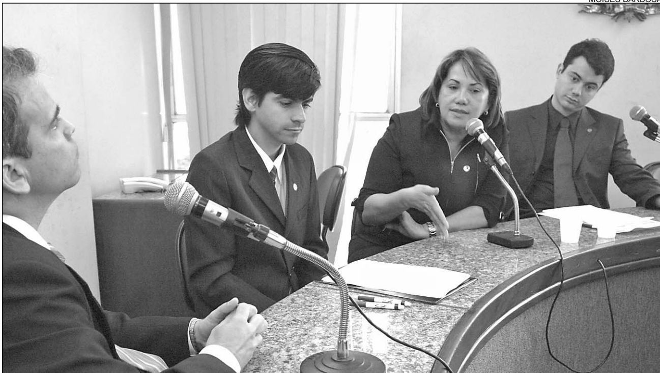
AGENDA - Idéia é percorrer as principais unidades da Região Metropolitana do Recife e avaliar as carências