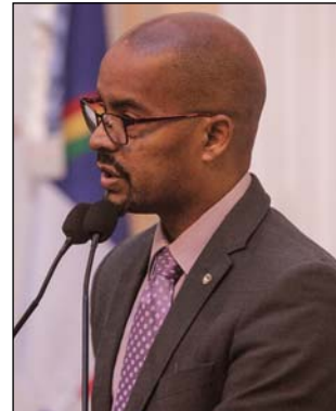
SILVA - Dignidade

nos escândalos de corrupção”, analisou. O parlamentar também comentou fatos da política estadual. Segundo Botafogo, apesar de fazer parte da base do