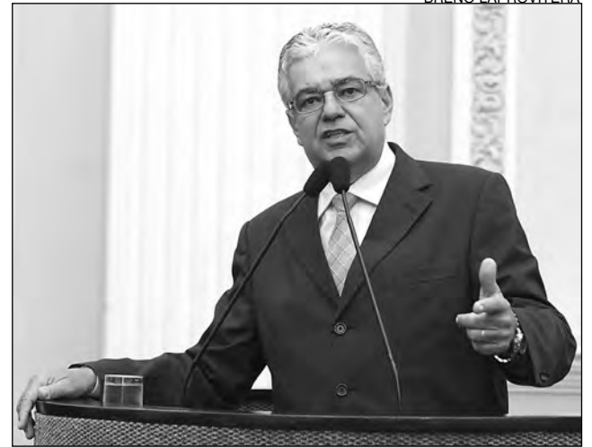
MATA NORTE – Moraes questionou situação precária