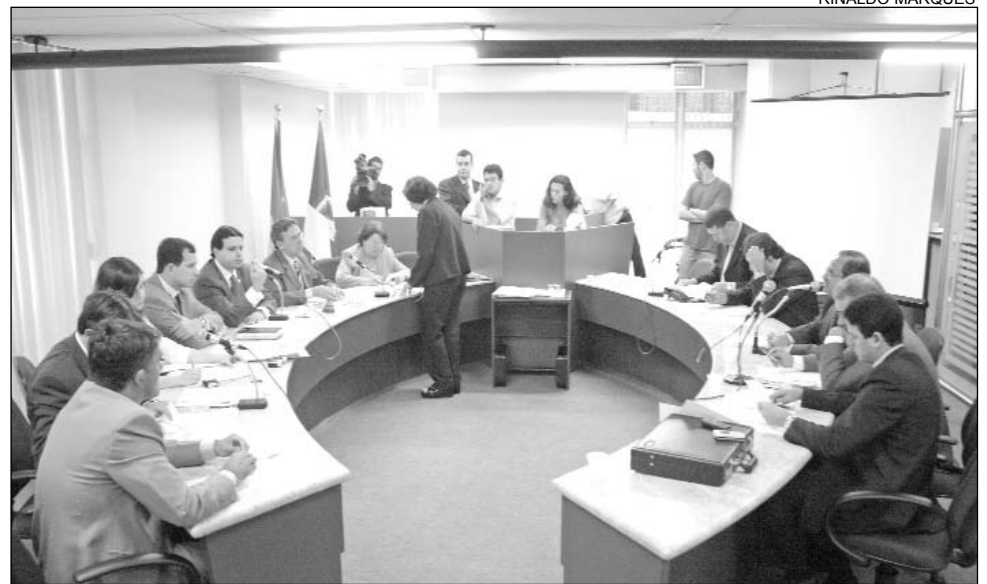
GRUPO - Composição é de nove parlamentares titulares e outros nove suplentes