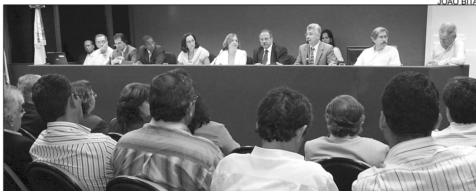
PROPOSTA - Poder Executivo deverá intermediar acordo entre municípios

Eurico defendeu a necessidade de uma solução definitiva para o problema dos resíduos sólidos da RMR. De acordo com o parlamentar, o Recife não tem área disponível para depositar o lixo e, há 30 anos, coloca-o em Jaboatão de forma inadequada. "O Ministério Público cuidou de estabelecer, por meio de termo de ajustamento de conduta, o prazo final, que encerra no dia 2 de julho deste ano, para a desativação do aterro controlado da Muribeca e a destinação de uma nova área para um aterro sanitário. Esse é o objeto dessa audiência porque não podemos aceitar que o Recife invada a compe-