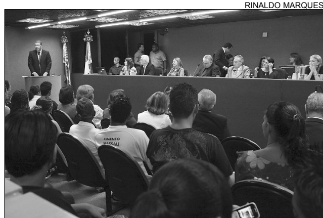
DESTAQUE - Parlamento reverenciou trabalho da ONG