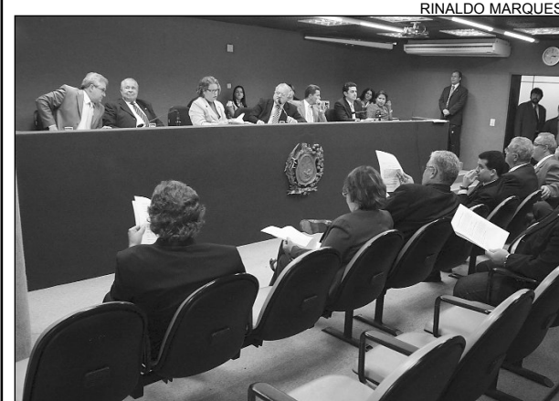
REUNIÃO - Alguns deputados questionaram iniciativa