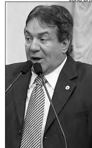
RÉGIS - Cobrança

GRANDE EXPEDIENTE – A fim de solucionar o impasse, a Assembleia Legislativa realizará um Grande Expediente Especial para discutir os problemas com a telefonia móvel em Pernambuco. Por solicitação dos deputados Tony Gel (DEM) e Rodrigo Novaes (PTC), o encontro está marcado para o dia 24 deste mês.