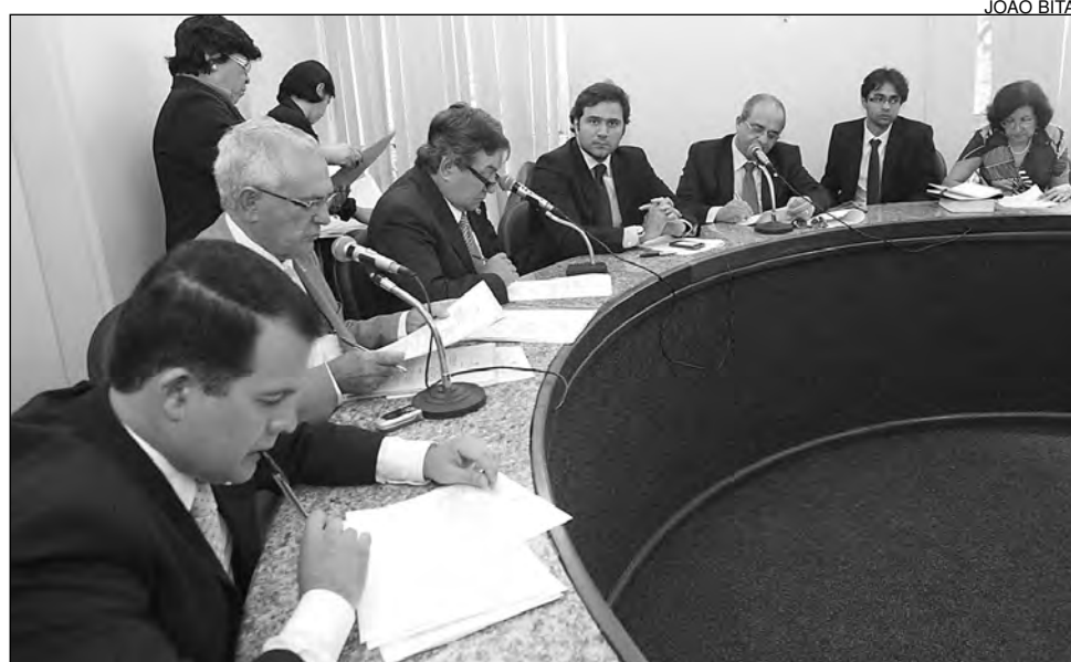
PROPOSTA - Parecer favorável na Comissão de Administração Pública da Alepe