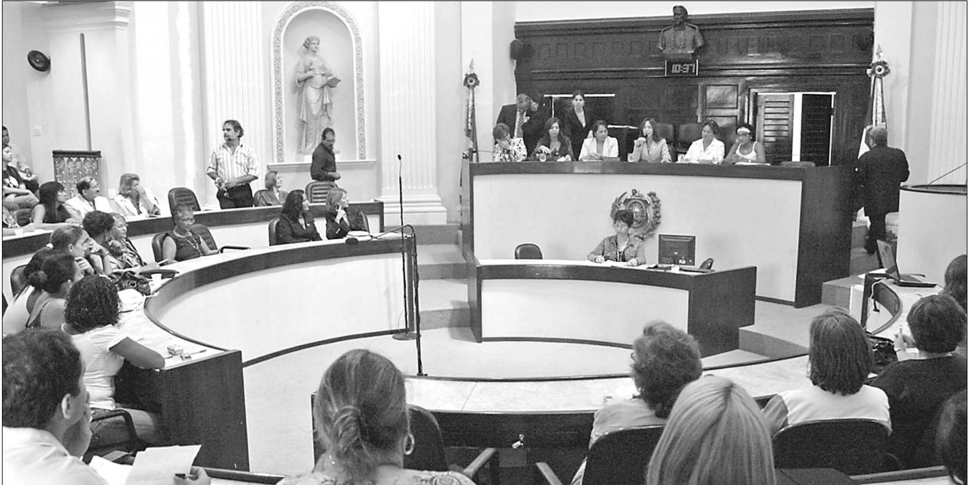
AUDIÊNCIA - Em março, no Plenário, foi lançado o Cordel Lição da Penha, que traduz, em linguagem popular, a Lei nº 11.340/06, conhecida como Lei Maria da Penha