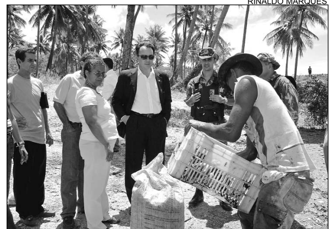
INSPEÇÃO - Comissão também esteve em Igarassu

A união de órgãos, como a Agência Pernambucana de Meio Ambiente (CPRH), Ministério Público do Estado, Gerência Regional de Patrimônio da União, juntamente com a Comissão de Meio Ambiente da Alepe, permitiu que, com a remoção