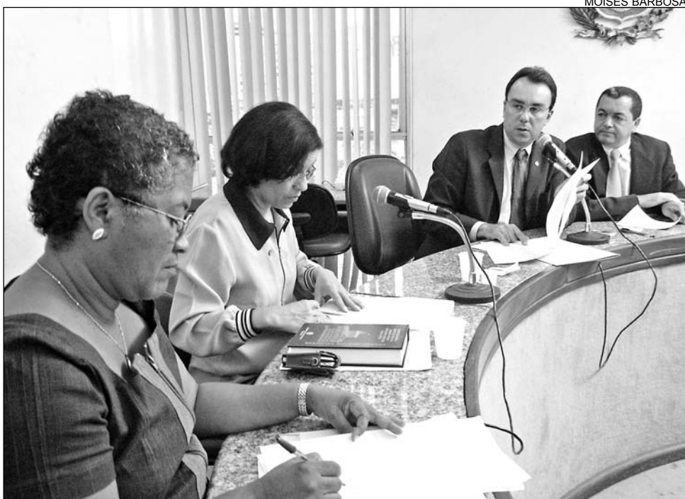
TRABALHO - Grupo parlamentar aprovou 17 projetos de lei no ano passado

Iniciativa foi uma das mais importantes ações do colegiado em 2005