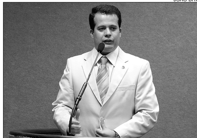
PERIGO - Trecho liga Santa Cruz do Capibaribe a Jataúba

Segundo Vieira, o aumento do fluxo de veículos, no final do ano, agrava o problema. “As pessoas são obrigadas a usar desvios ou estradas alternativas por causa das péssimas condições da via”, observou. O deputado informou, também, que já apresentou uma indicação, na Casa Joaquim Nabuco, sobre o assunto e que entrou em contato com a Secretaria de Transportes, mas não obteve resposta até o momento.