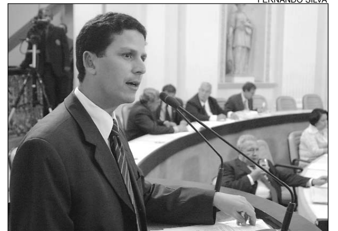
DOCUMENTOS - Tribunal de Contas está analisando

Entre as denúncias, estão a contratação de servidores em desacordo com a Constituição Federal; desvio de recursos públicos a partir de contratos nas áreas de transporte de estudantes, serviço de coleta de lixo, a execução indevida de programas, como o Bolsa Cidadã e o Sentinela; favorecimento pessoal na compra de material de construção, combustível e merenda escolar; além da falta de publicidade na execução orçamentária e nos processos licitatórios.