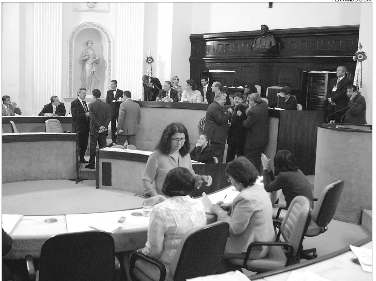
CONVOCAÇÃO - Parlamentares aguardam a chegada da mensagem do governador Jarbas Vasconcelos