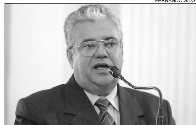
NÚMEROS - 14 assaltos a casas comerciais num único dia