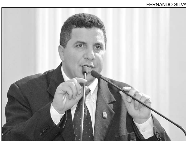
HISTÓRIA - Luta pela família e defesa dos necessitados

O parlamentar destacou que a tribuna é usada para elogiar homens e mulheres cujo alcance de suas obras é, "muitas vezes, limitado", porém "Jesus Cristo mudou o calendário, recriou o conceito de religião, trouxe princípios de ética, caráter, comportamento e, hoje, norteia decisões e hábitos". "É a partir de Cristo que podemos falar em perdoar os que nos ofendem, amar os que nos odeiam e agir em prol dos que precisam. Todos deveriam parar um pouco e lembrar aquele que, ao pensar em nós, pre-