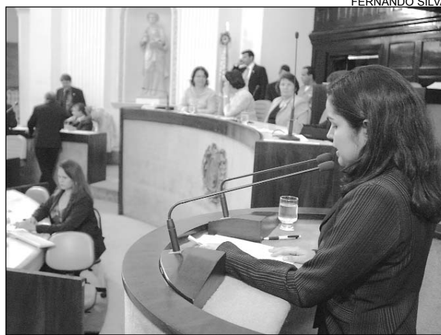
PAUTA - Socialista quer a retirada do Projeto de Lei nº 962

pauta de votação. Segundo ela, a beneficiária da proposição, a Associação Joaquim de Assis, está sob investigação do Ministério Público devido a irregularidades administrativas, uso indevido de verbas públicas e realização de contratos fictícios. "A retirada do projeto da pauta do Le-