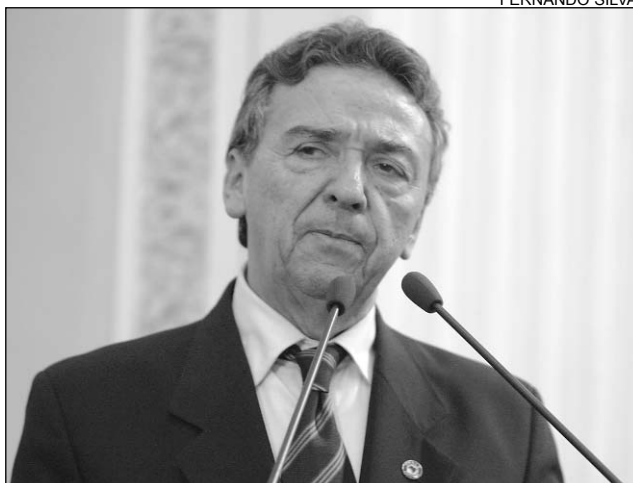
TECELAGEM - Opção por Paulista foi criticada

O pedetista ainda afirmou que os setores do Governo que deveriam agir, como a Secretaria de Desenvolvimento do Estado e a Agência de Desenvolvimento de Pernambuco (AD/Diper), "apenas raciocinam para criar o eldorado na área metropolitana". "O que incomoda é a insensibilidade dos dirigentes dos organismos de planejamento e desenvolvimento", criticou.