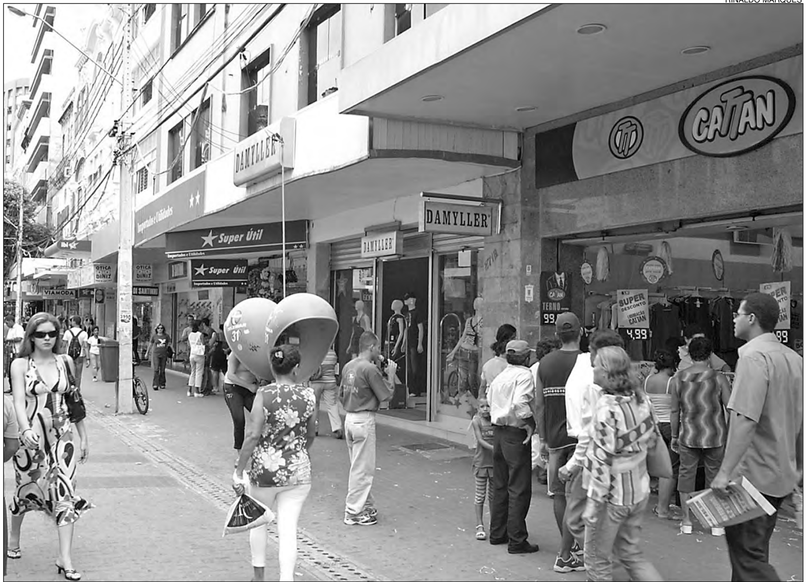
VENDAS - No Centro do Recife, onde estão localizadas lojas de diferentes segmentos, é comum a movimentação de compradores a qualquer hora