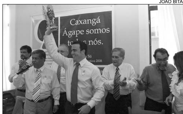
ALEGRIA - Primeiro-secretário mostra Troféu Thomé Dias

Parlamentares, prefeitos da Mata Sul, amigos e cor-religionários prestigiaram, ontem, o primeiro-secretário da Assembléia Legislativa, deputado João Fernando Coutinho (PSB), que recebeu do Caxangá Ágape o Troféu Thomé Dias, por Amor a Pernambuco, durante almoço no restaurante Boi Preto , no Pina, Recife. Na ocasião, João Fernando Coutinho também proferiu a palestra: Eficiência na Gestão: O Novo Paradigma na Administração Pública . O troféu é um reconhecimento pelos