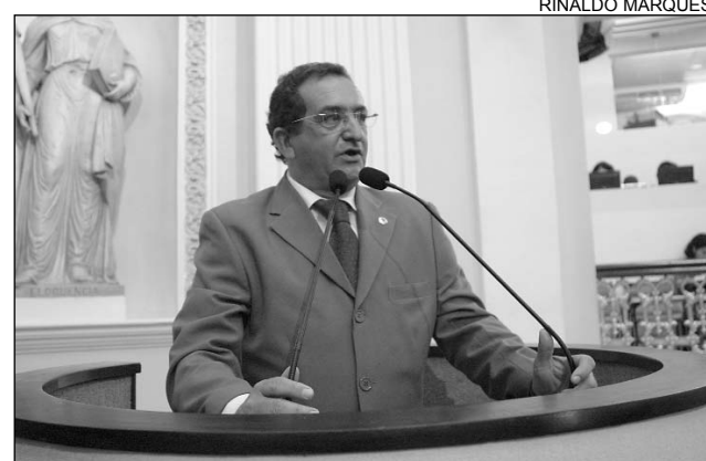
MATERIAL - Araripina produz 95% do consumo no País

Para Bringel, o material, largamente produzido no Araripe, tem condições de ser utilizado em todas as casas. "A iniciativa é importante para o desenvolvimento da região, já que cerca de 95% do gesso consumido no País é