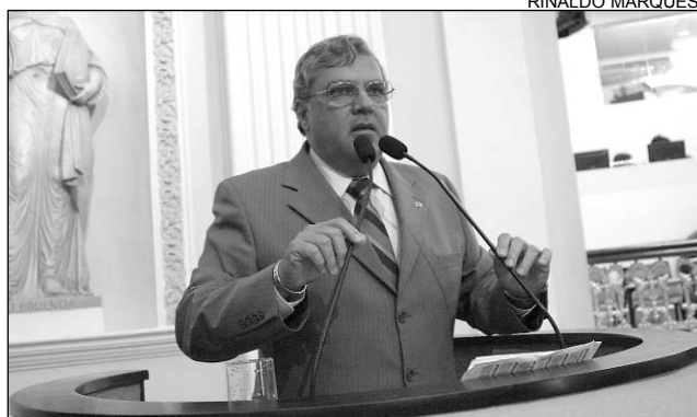
QUEIROZ - Posto e distribuidora lucram. Cliente no prejuízo

De acordo com Queiroz, o município do Cabo de Santo Agostinho, que fica na região metropolitana, apesar de ficar próximo ao Porto de