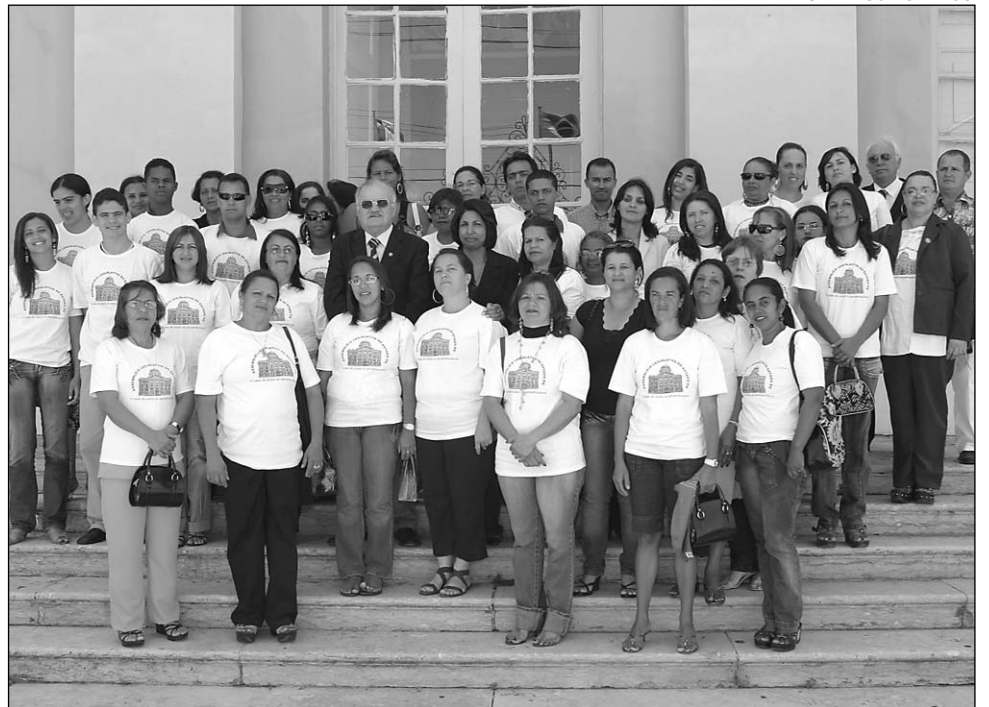
OPORTUNIDADE - Profissionais de Barra de Guabiraba parabenizaram iniciativa