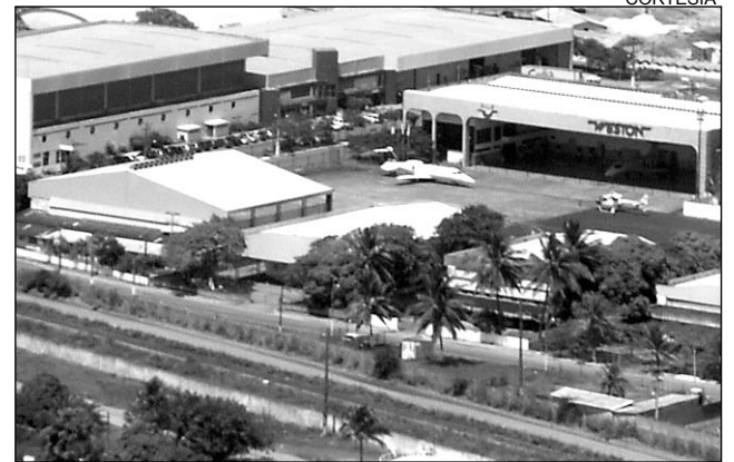
AEROPORTO - Menos turistas no Estado de Pernambuco