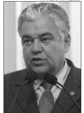
MORAES - Denúncia

O tucano também fez apelo para que o trabalho da Rocam, no interior do Estado, seja ampliado e intensificado. "É importante investigar e combater o crescente tráfico de drogas. Se não estancarmos a distribuição de entorpecentes, será impossível combater a violência", frisou.