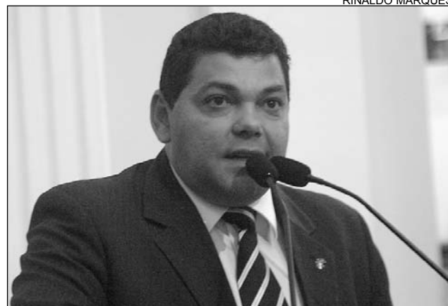
AGRADECIMENTO - Figueirôa elogiou Poder Executivo

Figueirôa lembrou que a iniciativa conta com a participação dos poderes executivos municipal e estadual, além do Poder Judiciário.