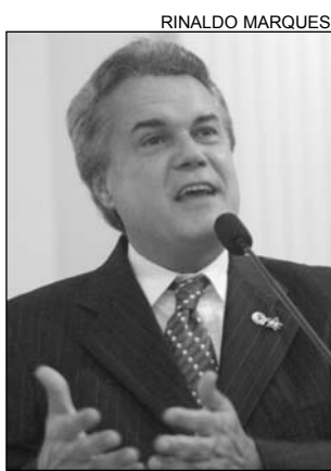
ANDRÉ - Sugestão

Para Campos, com a construção do parque, a população jaboatonense terá um espaço com muito verde, destinado ao lazer e pista de cooper, entre outras atividades.