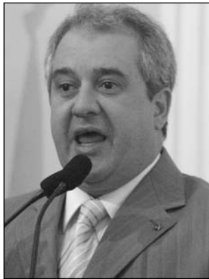
COUTINHO E ISALTINO - Considerações sobre a PCR

"Foram sete anos dessa gestão para chegar a conclusão de que o visual do Re-