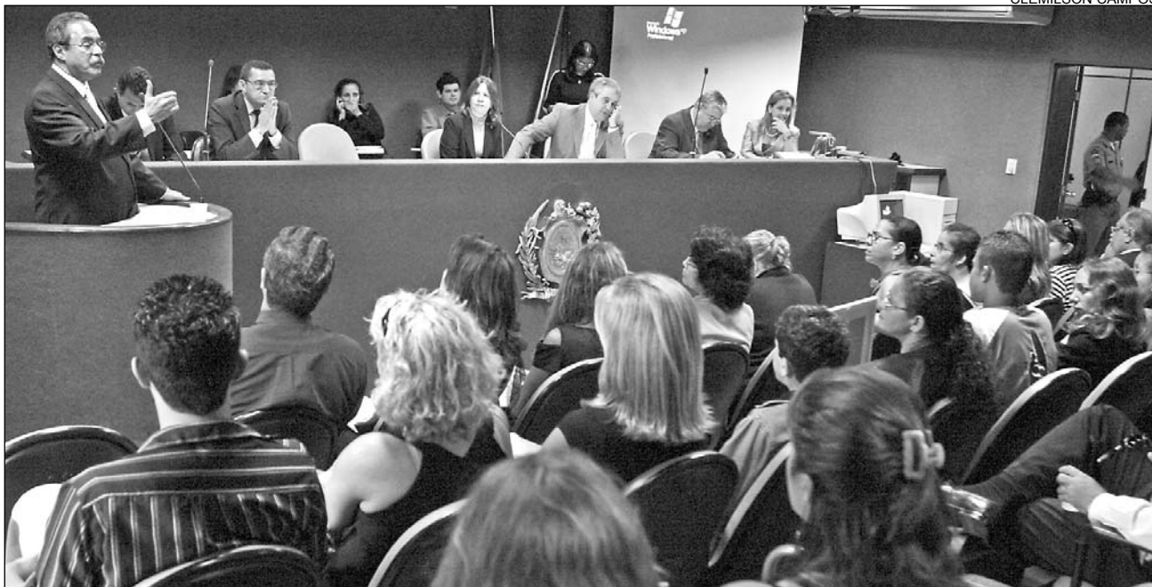
AUDIÊNCIA - Cidadania ouviu funcionários dos cartórios extrajudiciais no auditório da Casa Joaquim Nabuco